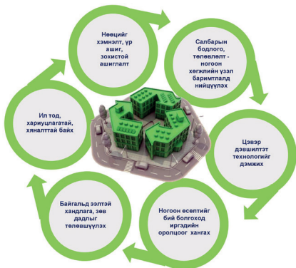
Ногоон хөгжлийн бодлогын баримтлах зарчим