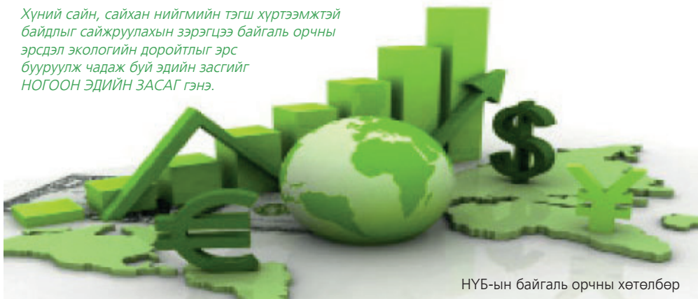
НҮБ-ын байгаль орчны хөтөлбөр

Хүний сайн, сайхан нийгмийн тэгш хүртээмжтэй байдлыг сайжруулахын зэрэгцээ байгаль орчны эрсдэл экологийн доройтлыг эрс бууруулж чадаж буй эдийн засгийг НОГООН ЭДИЙН ЗАСАГ гэнэ.