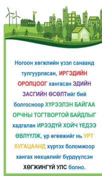
Ногоон хөгжлийн бодлогын зорилго ба стратегийн 6 зорилт